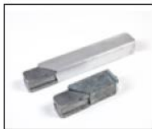
Schnellverbinder aus Metall zum Verschrauben