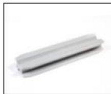
X-Verbinder aus Kunststoff zum Einschieben