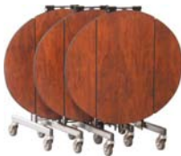
hochgestellt zur Lagerung