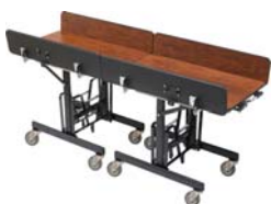
miteinander verbundene viereckige TRI-FOLD Tische zum Transport größerer Mengen