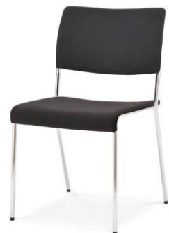
Modell 8022: Sitz- und Rückenpolster