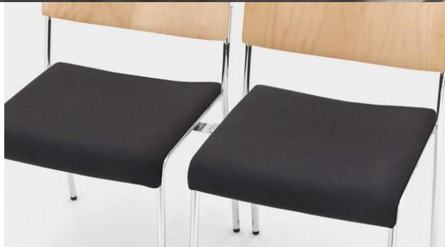
Modell 8021: Buche natur, Sitzpolster, mit Schiebe-Reihenverbindung