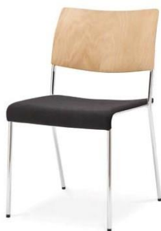
Modell 8021: Buche natur, Sitzpolster