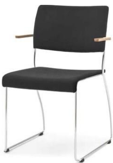
Modell 8012/A: Sitz- und Rückenpolster, Armlehnen Buche natur