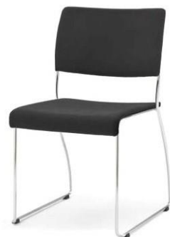
Modell 8012: Sitz- und Rückenpolster