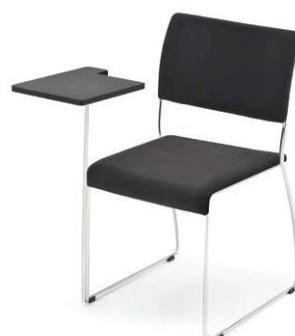
Modell 8012: Sitz- und Rückenpolster, mit Schreibtisch