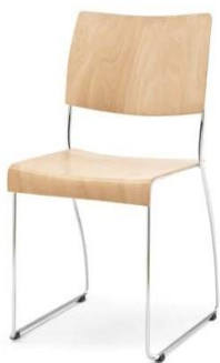
Modell 8010: Buche natur, ungepolstert