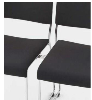
Modell 8012: Sitz- und Rückenpolster, mit Schiebe- Reihenverbindung