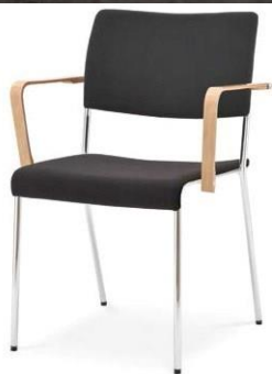
Modell 8022/A: Sitz- und Rückenpolster, Armlehnen Buche natur