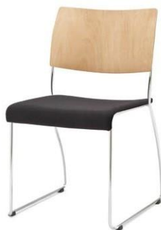
Modell 8011: Buche natur, Sitzpolster