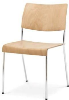
Modell 8020: Buche natur, ungepolstert